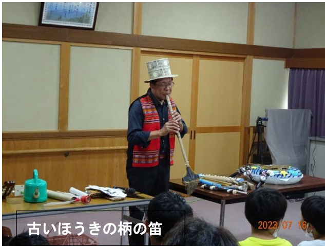
古いほうきの柄の笛